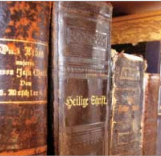
Die Bibel: Eine Sammlung von vielen Büchern.

„Es wohnten aber in Jerusalem Juden, die waren gottesfürchtige Männer aus allen Völkern unter dem Himmel. Als nun dieses Brausen geschah, kam die Menge zusammen und wurde bestürzt; denn ein jeder hörte sie in seiner eigenen Sprache reden. Sie entsetzten sich aber, verwunderten sich und sprachen: Siehe, sind nicht diese alle, die da reden, aus Galiläa? Wie hören wir denn jeder seine eigene Muttersprache? ... Juden und Judengenossen, Kreter und Araber: wir hören sie in unsern Sprachen von den großen Taten Gottes reden.“