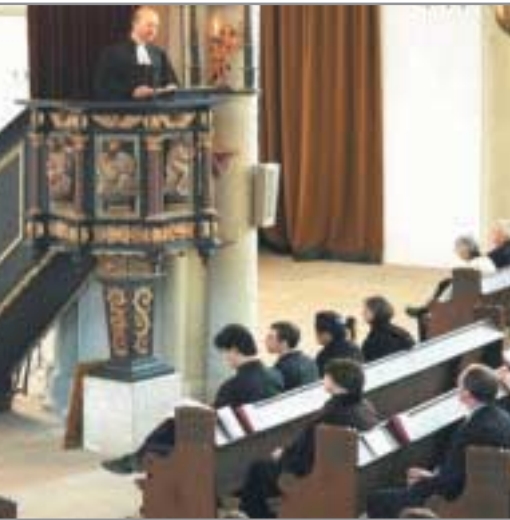
Die Predigt ist Auslegung des Wortes Gottes und steht im Zentrum des evangelischen Gottesdienstes.

Zum Heimischwerden von Muslimen in unserem Lande gehört das Erlernen der deutschen Sprache. Je besser jemand Deutsch sprechen kann, umso stärker ist er oder sie auch in das Alltagsleben und die Alltagsvollzüge unseres Landes integriert. Umso selbstverständlicher besteht auch die Möglichkeit, am Dialog zwischen den Kulturen und den Religionen teilzunehmen. Eine Sprache zu erlernen bedeutet mehr, als nur fremde Vokabeln zu beherrschen. Sprachvermittlung ist auch immer eine Vermittlung von Kultur. Von daher ist es zu verstehen, dass es gelegentlich in muslimischen Familien zu einer besonderen Betonung des „Moslemseins“ kommt, weil es Befürchtungen gibt, im Zuge des Sprachverlustes auch kulturelle und religiöse Bezüge zu verlieren.