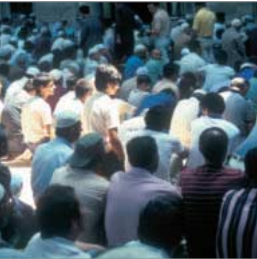
Ein Jude kann nur als Jude beten, eine Christin nur als Christin und ein Muslim nur als Muslim.

In einer interreligiösen Feier werden alle Gebete und Texte von den Religionsgemeinschaften gemeinsam verantwortet. Eine solche Feier steht in der Gefahr, vorhandene Glaubensgegensätze zu verschleiern und die jeweils anderen für die eigenen religiösen Vorstellungen zu vereinnahmen. Darum sollten Kirchengemeinden, wenn Glaubensinhalte im Mittelpunkt stehen, von solchen Feiern absehen.