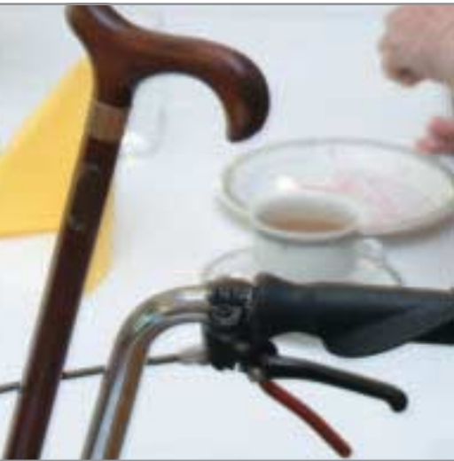
Evangelische Altenpflege beachtet auch andere religiöse Traditionen und Gewohnheiten.

Für die ambulante Altenhilfe ist zu beachten, dass das familiäre Engagement bei der Pflege von Angehörigen in der Regel beträchtlich ist. Dieses kann eine große Hilfe bei der Beachtung von religiösen Vorschriften und Geboten und bei der Respektierung der Hygienevorstellungen sein. Von den Pflegenden sind bestimmte Verhaltensregeln zu beachten, z. B. auch, dass die Wohnung nur nach Erlaubnis der Bewohner mit Straßenschuhen zu betreten ist.