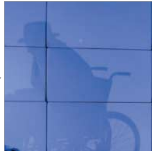
Eine Herausforderung für evangelische Trägereinrichtungen ist der Umgang mit muslimischen Altenheimbewohnern.

Für viele ältere Muslime ist Deutschland auch der Alterssitz. Da sich auch deren Familien in ihren traditionellen Strukturen verändern und auflösen beginnen, hat nicht mehr jeder pflegebedürftige Moslem einen Platz in seinem Familienverband. Gegen die Inanspruchnahme diakonischer ambulanter und stationärer Pflege- und Betreuungsangebote bestehen nicht selten seitens der Betroffenen erhebliche Vorbehalte, da das Annehmen solcher Hilfe als Versagen der eigenen familiären Strukturen betrachtet wird. Altenpflege von Menschen, die in anderen Kulturkreisen groß geworden sind, ist bisweilen besonders schwierig. Im Alter wird die zuletzt erlernte