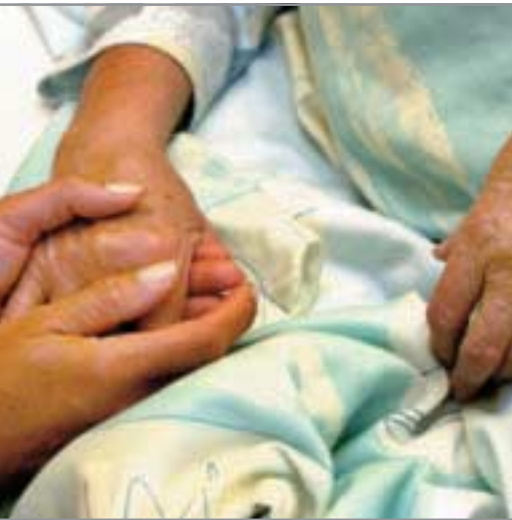
Anteilnahme und sprachliche Verständigung sind wesentliche Bestandteile einer guten Pflege.

Daher ist es wünschenswert, dass Muslimen in Krankenhäusern ein Raum zur Verfügung steht, den sie für das Gebet nutzen können, und dass ihnen eine Einhaltung der Gebetszeiten – soweit sich dies mit dem Klinikbetrieb und dem Zustand des Patienten vereinbaren lässt – ermöglicht wird. Dieses Anliegen ist getragen von der Überzeugung, dass die Gestaltung des Glaubens in Gebet und rituellen Formen dem Menschen in Krankheit wie in Gesundheit hilft und mit zur Gesundung und Heilung beitragen kann.