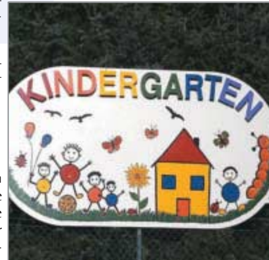
Evangelische Kindergärten fördern die Persönlichkeitsentwicklung und haben immer den ganzen Menschen im Blick.

Dies macht eine differenzierte Herangehensweise erforderlich. Wenn viele Kinder mit muslimischem Hintergrund evangelische Kindergärten besuchen oder in einzelnen Einrichtungen sogar die Mehrheit bilden, entsteht ein erhöhter Vermittlungsbedarf zwischen den verschiedenen Werten, Normen