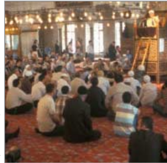
Der Besuch der Freitagspredigt ist eine Pflicht für alle muslimischen Männer.

Bei der Integration in unsere Gesellschaft geht es nicht um die Assimilation von Muslimen. Niemand darf den anderen vorschreiben, genauso zu leben, wie er oder sie selber lebt. So stellt das Zusammenleben mit Muslimen auch Herausforderungen an die heimische Bevölkerung. Sie ist aufgerufen, sich um Verständnis und Verständigung zu bemühen, auch bei Fremdheit Toleranz zu üben und Hindernisse für ein achtungsvolles Miteinander aus dem Weg zu räumen.