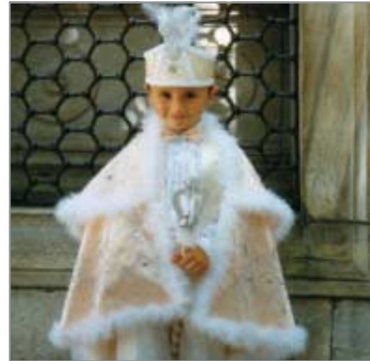
Muslimischer Junge in der traditionellen Festkleidung zur Beschneidung.

Zu Schwierigkeiten kann es führen, wenn Muslime einen Unbekannten mit Salam alaykum (Friede sei mit euch) grüßen. Normalerweise wird auf diesen Gruß mit Alaykum as-Salam geantwortet (Mit euch sei Friede). Da dieses Grußritual auch als Erkennungszeichen für die gemeinsame Religion gilt, vermeiden viele Muslime diesen Gruß in der Begegnung mit Nicht-Muslimen, um diese nicht in eine unangenehme Situation zu bringen. Christen sollten diese Grußformel Muslimen gegenüber grundsätzlich nicht benutzen, um Missverständnisse zu vermeiden.