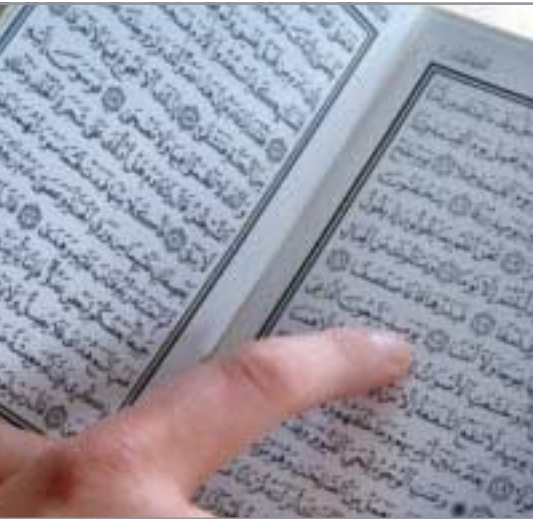
Der Koran wird von Muslimen meistens im arabischen Original gelesen und auswendig gelernt.

Wohl aber gibt es in beiden Religionen Anknüpfungspunkte für einen religiösen Dialog in gegenseitiger Wertschätzung. Beide Religionen sprechen von Gott als dem Schöpfer der Welt und von Gott als Richter am Ende der Zeit. Beide Religionen rufen auf zur Achtung des menschlichen Lebens und zur Weltverantwortung. Gewinn bringend für ein verständnisvolles Miteinander wie auch für die eigene Glaubensvergewisserung kann es zudem sein, sich über die jeweilige Sicht der Personen auszutauschen, die sowohl in der Bibel als auch im Koran eine bedeutende Rolle spielen, wie etwa Abraham, die Propheten, Maria oder Jesus.