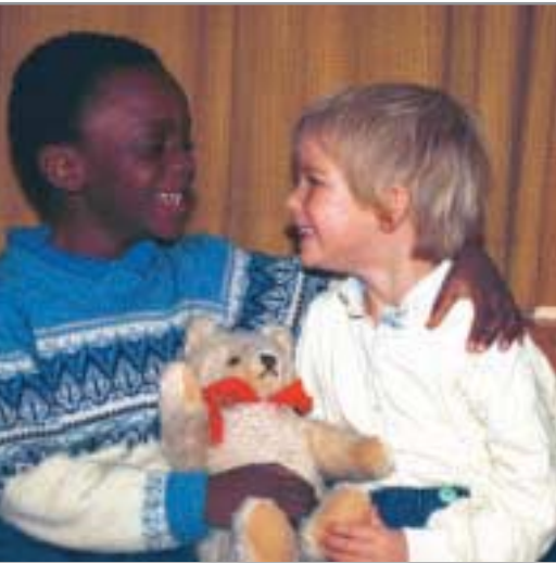
Zur christlichen Grundhaltung gehört auch die Überzeugung, dass jeder Mensch einmalig ist.

Die Trägerschaft evangelischer Kindergärten liegt zumeist bei den Kirchengemeinden. Der kirchliche Auftrag dazu wurzelt zum einen in der Taufverpflichtung der Gemeinde, Eltern bei der christlichen Erziehung ihrer Kinder zu unterstützen, zum anderen im sozialdiakonischen Auftrag der Kirche, den Erziehungsauftrag des Elternhauses zu ergänzen. Dieser Auftrag umfasst neben der Erziehungsaufgabe auch die Aufgabe der Betreuung und der Bildung.