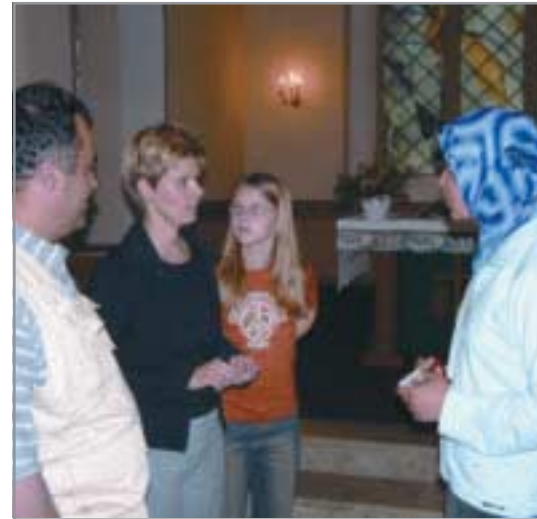
Ein wichtiger Bestandteil des Dialogs ist der gegenseitige Besuch von Gottesdienststätten.

Verabredet man sich mit Muslimen zum Essen in einem Lokal, sollte man beim Bezahlen die bei uns übliche Gepflogenheit vermeiden, die Rechnung genau aufzuschlüsseln. In muslimischen Ländern ist es üblich, dass entweder einer alles bezahlt oder die Gäste jeweils mit einem gleichen Anteil die Rechnung begleichen.