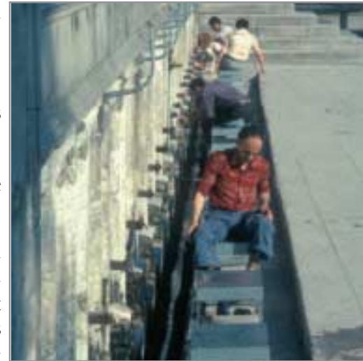
Vor dem Gebet waschen Muslime Gesicht, Hände und Füße.

Der Islam vertritt nach wie vor einen politischen und einen religiösen Herrschaftsanspruch. Für Muslime unterteilt sich die Welt in das Haus des Islam (arab. dar-al-Islam) und das Haus des Krieges (arab. dar-al-harb), wobei die Ausweitung des dar-al-Islam angestrebt wird.