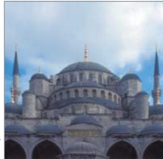
Die Süleyman-Moschee in Istanbul gilt als eine der schönsten Moscheen weltweit.

Dem einen Unrecht kann man nicht mit einem anderen Unrecht begegnen. Christen in Deutschland sollten mit Verständnis darauf reagieren, wenn andere Menschen ihren Glauben auch nach außen hin sichtbar leben wollen. Schließlich nehmen sie dieses Recht auch für sich in Anspruch. Andererseits sollten Muslime berücksichtigen, dass der Bau einer Moschee um so mehr von der Mehrheit akzeptiert wird, als sich die muslimische Gemeinde selber um Integration bemüht. Dazu gehört auch, zu prüfen, inwieweit eine Moschee in Deutschland unbedingt einer Moschee in der Türkei gleichen muss. Auch sollten muslimische Gemeinden darauf verzichten, ihrer Moschee einen Namen wie „Fathi Moschee“ („Eroberer-Moschee“) zu geben. Solche Namensgebungen schaffen unnütze Irritationen.