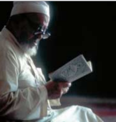
Koranleser in der Al-Azhar-Moschee in Kairo.

Zentraler Inhalt des christlichen Redens von Gott ist deshalb die Botschaft von der Liebe Gottes, die in Jesus Christus anschaulich gewor-