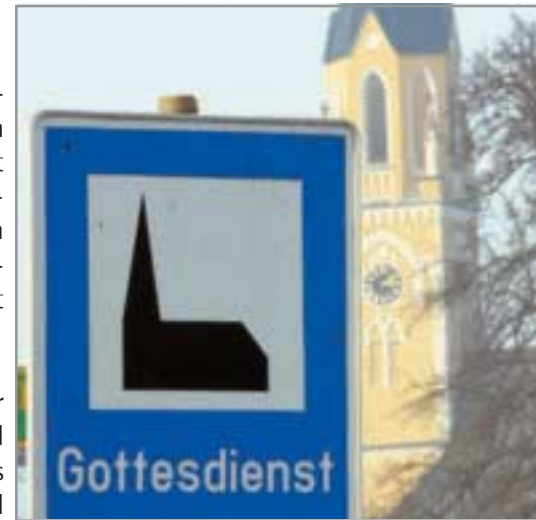
Am Ortseingang nicht zu übersehen: Menschen sind zum Gottesdienst eingeladen.

Bei Eheschließungen zwischen Christen und Muslimen kann in der Evangelischen Kirche von Westfalen auf Wunsch des Paares und vor allem mit dem Einverständnis des nicht-christlichen Partners ein „Gottesdienst anlässlich der Eheschließung von Christen und Nichtchristen“ stattfinden. Dazu liegt eine entsprechende Arbeits-hilfe der Evangelischen Kirche von Westfalen vor. Ein Kind aus einer ge-mischt religiösen Ehe kann, wenn ein Elternteil evangelisch ist, getauft und konfirmiert werden.