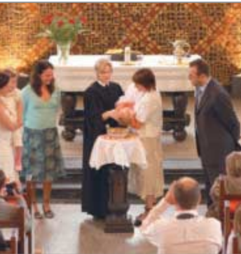
In der Taufe sagt Gott „Ja“ zu einem Menschen.

Der christliche Glaube gründet auf dem Evangelium von Jesus Christus, auf der gnädigen Zuwendung Gottes, die allen Menschen gilt. Christen erkennen in Christus das uns Menschen zugewandte Antlitz Gottes und sind im Auftrag des Auferstandenen zu allen Völkern gesandt, um sie zu taufen und um die Lehre Christi zu verbreiten.