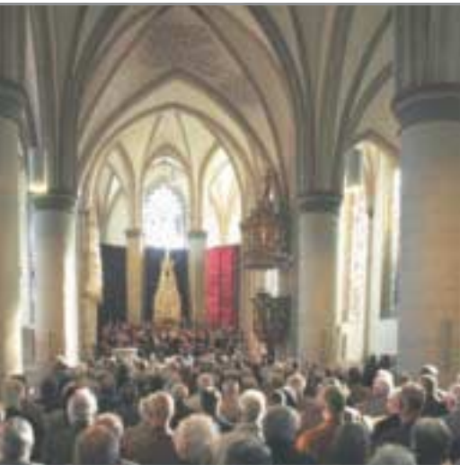
Der Gottesdienst steht im Zentrum der evangelischen Gemeinde.

Das Recht auf Religionsfreiheit gehört zu den grundlegenden Menschenrechten. Es ist durch die Allgemeine Erklärung der Menschenrechte (Art. 18) und durch das Grundgesetz der Bundesrepublik Deutschland (Art. 4) geschützt. Für das Zusammenleben von Christen und Muslimen sowie Menschen anderer religiöser oder weltanschaulicher Überzeugungen ist das Recht auf Religionsfreiheit von zentraler Bedeutung. So wird der universale religiöse Geltungs- und Wahrheitsanspruch, wie ihn Christentum und Islam vertreten, mit der Akzeptanz der Gleichheit und Gleichberechtigung aller Menschen verbunden. Dazu gehört auch, dass in Fragen des Glaubens kein Zwang ausgeübt werden darf. Zur Freiheit, einen Glauben zu praktizieren, gehört auch die Freiheit, nicht zu glauben oder sich von der eigenen Religion abzuwenden. Sowohl für die sog. positive wie auch für die sog. negative Religionsfreiheit gilt jedoch, dass dieses Grundrecht nicht die Grundrechte anderer Menschen beeinträchtigen darf.