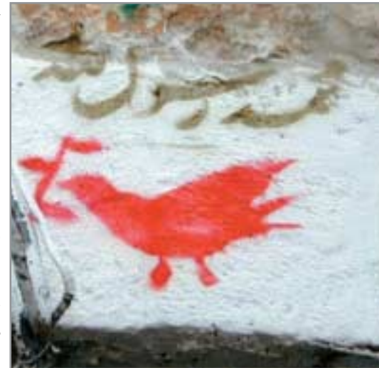
Friedenssymbol auf einer Hausmauer in Ost-Jerusalem.

Lädt jedoch die Kirchengemeinde in die Kirche ein, muss an der Gestaltung wie an den Inhalten deutlich werden, dass es sich um eine christliche Feier oder einen Gottesdienst handelt, zu denen auch Muslime eingeladen sind. Diese können durch ein Grußwort oder einen verlesenen Text die Verbun-