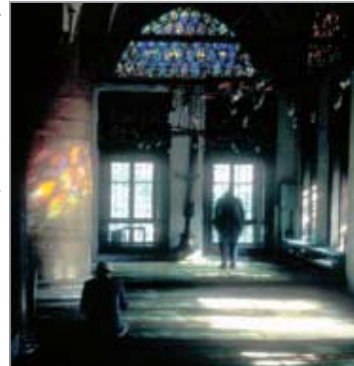
Betende Männer in einer Istanbuler Moschee.

Die Gemeinsamkeiten und Differenzen in der Grundstruktur der christlichen und der islamischen Ethik wirken sich im Blick auf konkrete ethische Forderungen aus. Beispielhaft sei aus dem Bereich des Politischen das Strafrecht genannt. Sowohl in der Bibel wie auch im Koran finden sich Aussagen, die für