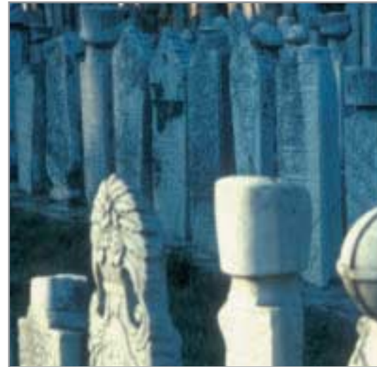
Zur islamischen Bestattungskultur gehören meist auch Grabsteine mit besonderer Formensprache.

Im respektvollen und hilfreichen Umgang mit Muslimen bringen Christen zum Ausdruck, dass ihrer Glaubensüberzeugung nach das erlösende Handeln Gottes nicht nur ihnen, sondern allen Menschen gilt. Es ist daher eine besondere Aufgabe von Christen, dabei mitzuhelfen, dass Muslimen die Bestattung ihrer Angehörigen in Würde ermöglicht wird.