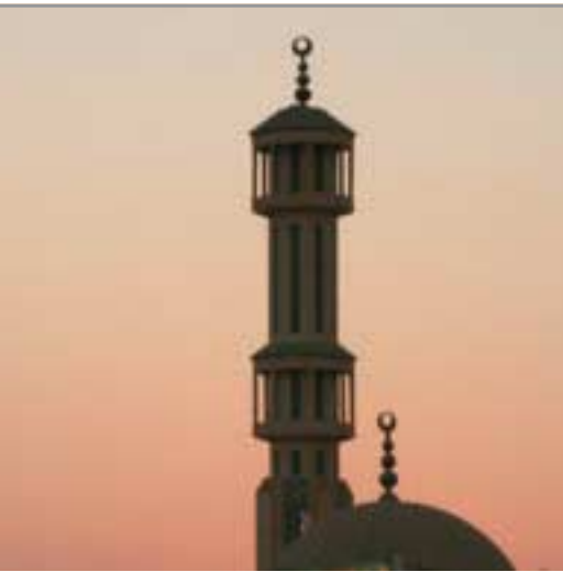
Fünfmal am Tag ruft der Muezzin zum Gebet.

Fünfmal am Tag werden die Gläubigen in islamischen Ländern vom Muezzin zum Gebet gerufen. Dieser Ruf erfolgt auf arabisch und hat folgenden Wortlaut: „Gott ist größer (viermal). Ich bezeuge, dass es keinen Gott gibt außer Gott (zweimal). Ich bezeuge, dass Mohammed Gottes Gesandter ist (zweimal). Auf zum Gebet (zweimal). Auf zum Heil (zweimal). Gott ist größer (zweimal). Es gibt keinen Gott außer Gott (einmal).“ Der zweite und dritte Ruf des Muezzin ist eine Kurzform des muslimischen Glaubensbekenntnisses. Er ruft daher nicht nur zum Gebet, sondern bekennt auch öffentlich seinen Glauben. Das unterscheidet den Gebetsruf grundsätzlich vom Geläut der Kirchenglocken.