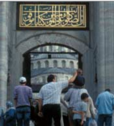
Andrang beim Freitagsgebet in der Sultan-Ahmet-Moschee in Istanbul.

In beiden Religionen ist Gottes Wille grundsätzlich auf das Wohlergehen und den Frieden der Menschen gerichtet, und auch die Ehepartner sollen in „Liebe und Barmherzigkeit“ einander zugetan sein (vgl. Sure 30,21: „Und er hat Liebe und Barmherzigkeit zwischen euch gemacht.“). Darum ist eine Ebene der Verständigung darüber gegeben, dass auch das alltägliche Leben zwischen den Geschlechtern nach Gottes Willen dem Frieden und Wohl aller gleichermaßen dienen soll.