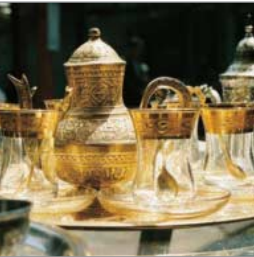
Die Gastfreundschaft gehört zum Selbstverständnis des Islam.

Gäste – auch unerwartete – willkommen zu heißen und zu bewirten ist für Muslime geradezu eine religiöse Pflicht. In nomadischer Zeit konnte Gastfreundschaft sogar lebensrettend sein. Wer heute bei einer muslimischen Familie eingeladen ist, sollte ein paar einfache, aber wichtige Dinge beachten.