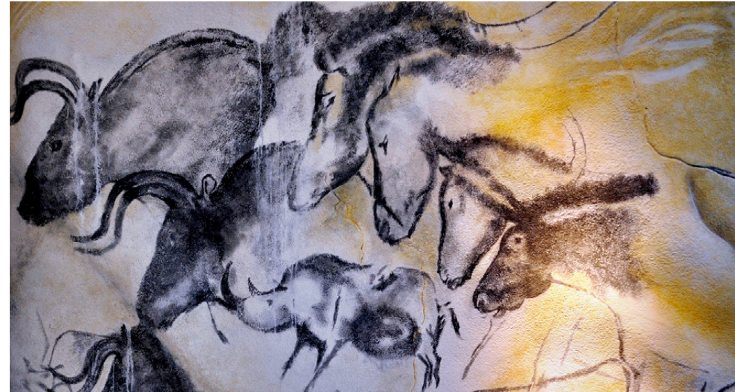
Etwa 30.000 Jahre alte Tierdarstellungen in der Chauvet Höhle in Frankreich

Tatsächlich frei aber wurden die Bilder – dies die weithin wirksame These des Kunstwissenschaftlers Werner Hofmann – durch die Reformation, die protestantische Bildkritik hat Bilder gleichsam tiefer gehängt: Sie können weder erlösen noch verdammen, sind weder gut noch böse, „mit diesem Freibrief beginnt die Moderne“. Warum? Weil nun auch vor dem Bild, so Hofmann, die Freiheit eines Christenmenschen gilt, er ist es,