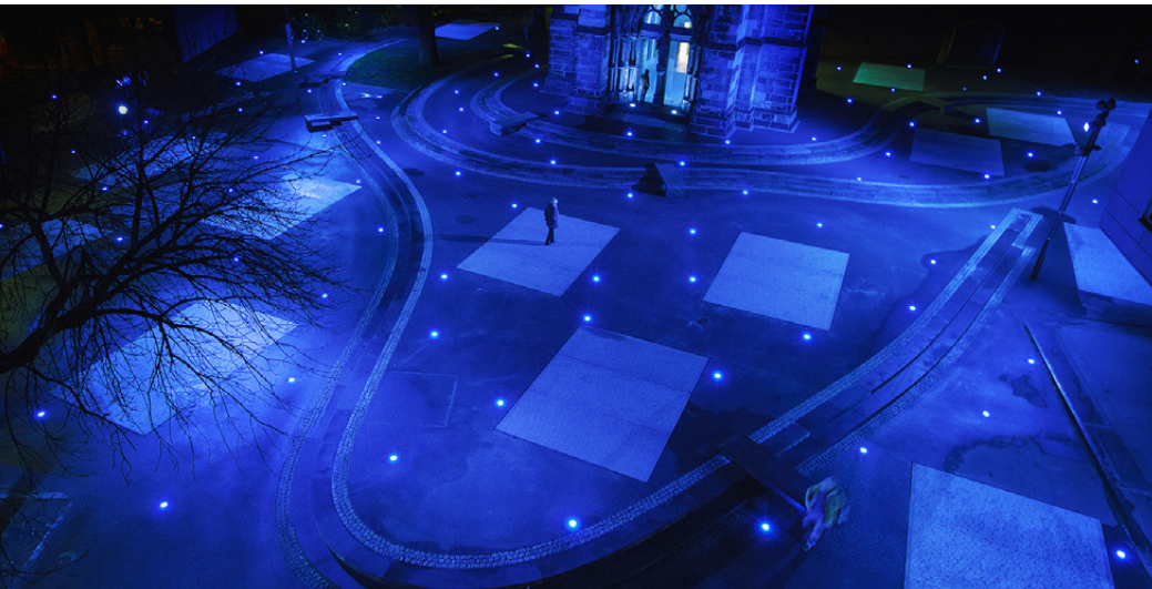
Platz des europäischen Versprechens

göttlichen Geist und Hinweis sein könnte auf das, was der Mensch als Gottes Geschöpf und Ebenbild werden soll. Was wollen wir mögen, was dürfen wir hoffen – protestantische Kirchen sind öffentliche Räume für die Frage nach Gott. 20