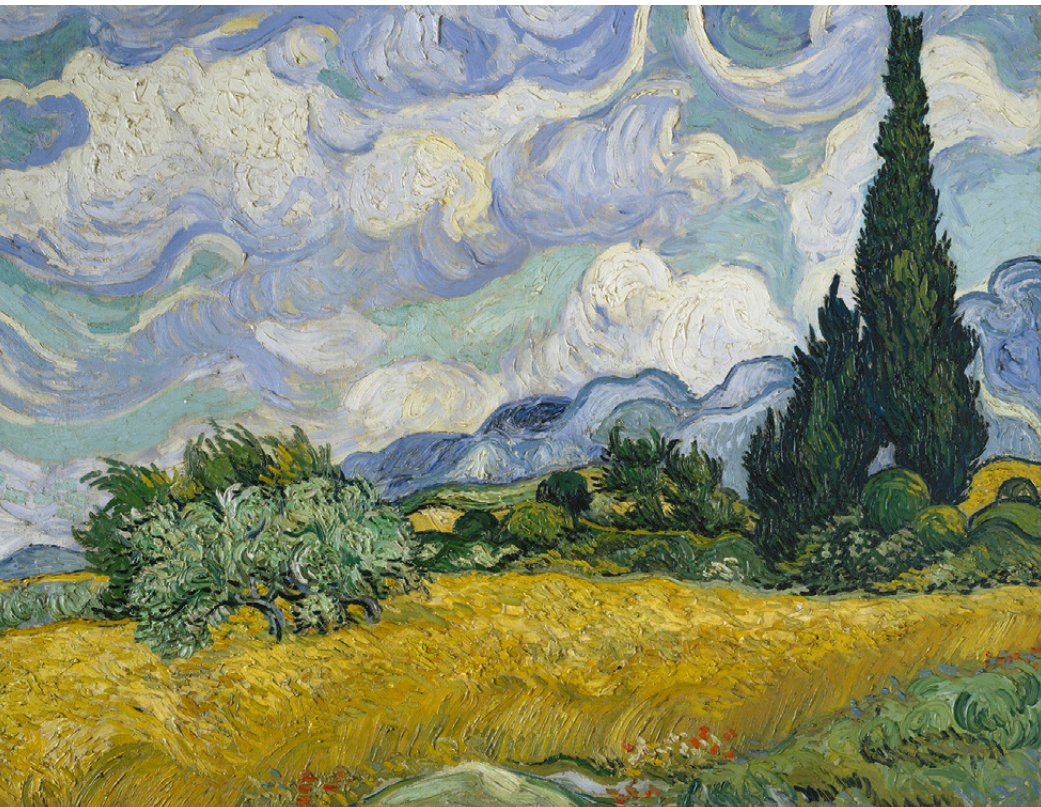
Weizenfeld mit Zypressen, Vincent van Gogh