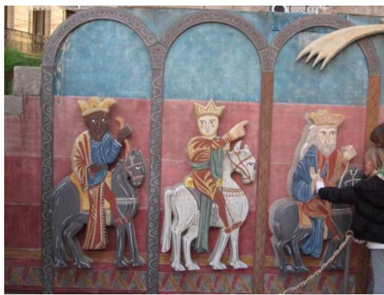
Begehbare Weihnachtsgeschichte, Fußgängerzone Barcelona, Advent 2011

Begehbare Krippe: Stationen der Weihnachtsgeschichte mit großen Figuren in einem abgegrenzten Bereich können im Einbahnstraßensystem abgegangen werden.